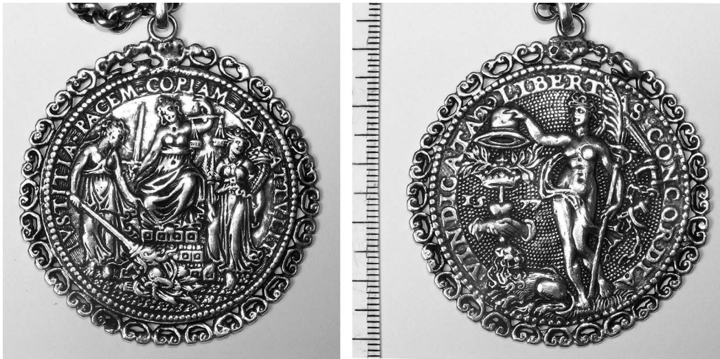
Jacob Jonghelingk, Gegoten zilveren penning op het Eeuwige Edict, met aangesoldeerde vuurstaalrand, 1577

Jonghelinck, zinspeelden op de gunstige gevolgen van het Eeuwige Edict. 15 De pas onderhandelde vrede werd zo vanuit de besloten diplomatieke ruimte gehaald en breed in de samenleving verspreid, voornamelijk in de vijftien provinciën waar het verdrag positief werd onthaald. Zoals veel andere vredesverdragen creëerde het Eeuwige Edict eerder een vertrekpunt voor vrede dan een bezegeling van een bestaande rust. De verdragspunten moesten immers nog worden uitgevoerd, voordat mogelijk een verzoening tussen de partijen kon plaatsvinden. Die implementatie van de verdragspunten – de echte vredeshandel – gebeurde achtereenvolgens vanuit de steden Leuven, Brussel en Mechelen.