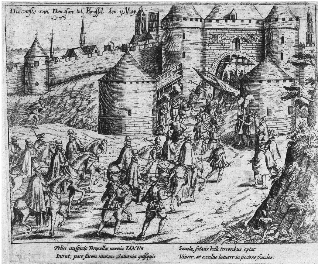
Frans Hogenberg, Dincomste van Don Jan tot Brussel den ij May 1577 , kopergravure, 1613-1615 Rijksmuseum Amsterdam