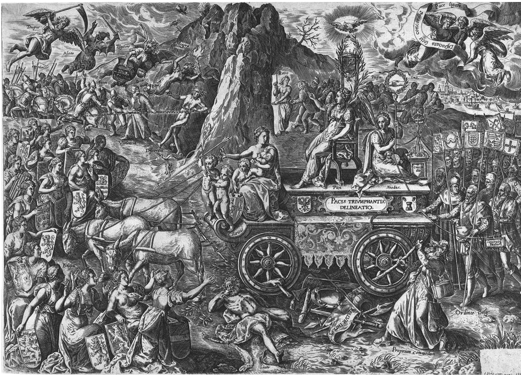
Gebroeders Wierix, Triomfwagen van de Vrede , c. 1577, kopergravure