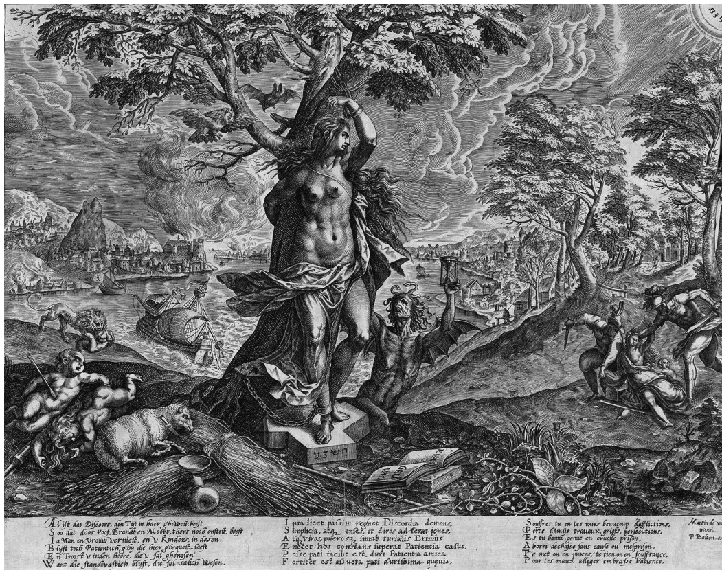
Gebroeders Wierix, Geduld , c. 1577, kopergravure Rijksmuseum Amsterdam

verdrag. In het begin van 1577 leek het Eeuwig Edict een meer dan welkom rustpunt in de reeds tien jaar aanslepende troebelen in de Zeventien Provinciën. In het halfjaar dat volgde stokte het pacificatieproces, ook al omdat de prins van Oranje als leider van de opstandelingen het vredesverdrag weigerde te erkennen. Toen op 24 juli landvoogd Don Juan de citadel van Namen innam om er een militaire uitvalsbasis van te maken, werd het pacificatieproces zowel door koningsgezinden als opstandelingen gestaakt. 3 De gebroeders Wierix verwerkten in hun gravures dus tegelijkertijd de publieke opinie